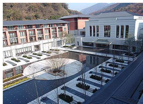
エクシブ京都八瀬離宮

(※1) 「リゾートトラスト エクシブ」との提携により、 「セラヴィリゾート 泉郷」は平成22年9月30日をもって契約を終了いたします。