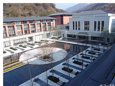
エクシブ 京都八瀬離宮