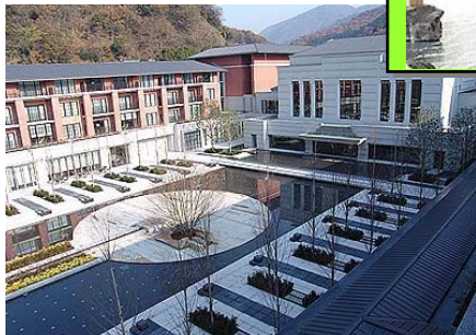
エクスプリゾート京都八瀬離宮