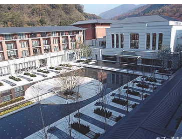
エクシブ京都 八瀬離宮