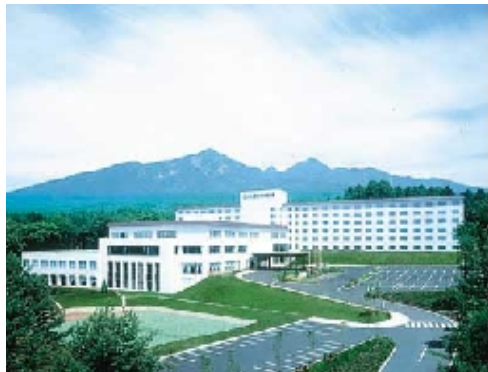
八ヶ岳ロイヤルホテル（大泉高原）