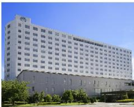
信州松代ロイヤルホテル