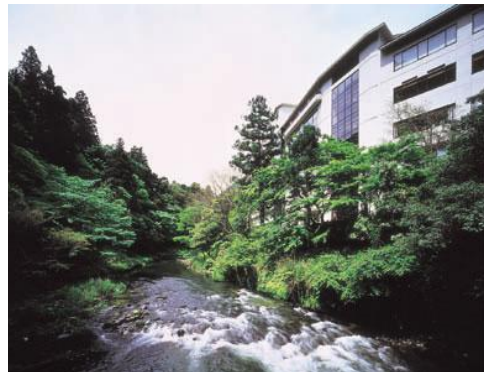
河鹿荘ロイヤルホテル（山中温泉）