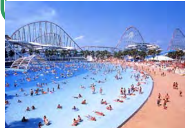
長島ジャンボ海水プール