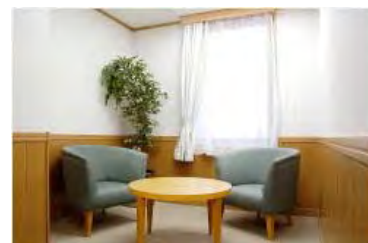
ティーバックカウンセリングルーム