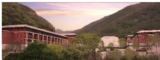
エキシブ京都八瀬離宮

(注) ブロックルーム：当健保組合であらかじめ確保している部屋のことをいいます。料金は通常の申込みと同じです。