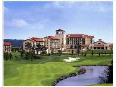
グランドエクシブ那須白河

全国 41 箇所の施設のご利用が可能です (リゾートピア・サンメンバーズ・トラスティを含む)