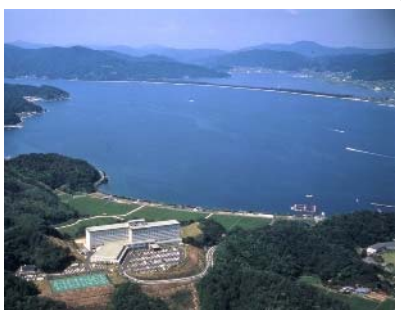
天橋立 宮津ロイヤルホテル