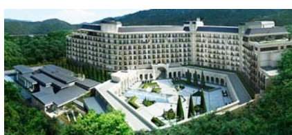
エキシブ有馬離宮