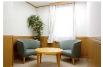
ティーベックカウンセリングルーム