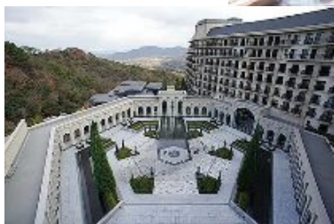
エクシブ有馬離宮