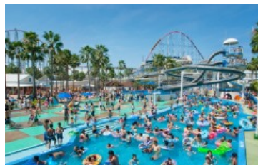
長島ジャンボ海水プール