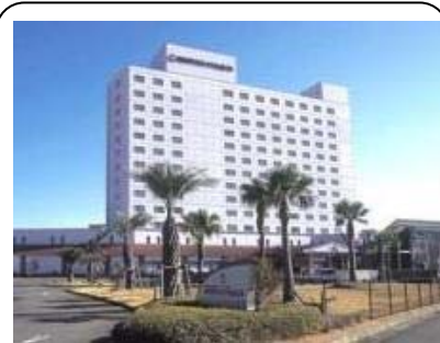
串本ロイヤルホテル