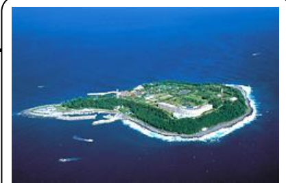
エクシブ初島クラブ

全国 41 箇所の施設のご利用が可能です (リゾートピア・サンメンバーズ・トラスティを含む)