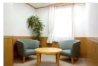
ティーバックカウンセリングルーム