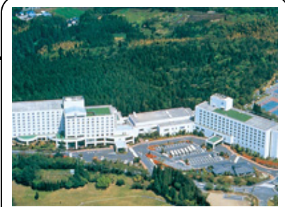
霧島ロイヤルホテル