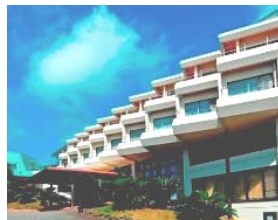
ホテルアンピエント伊豆高原