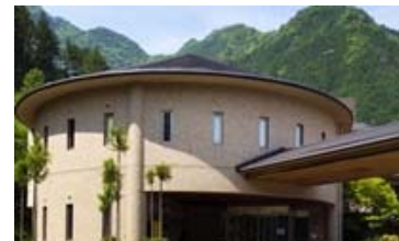
松阪わんわんパラダイスホテル