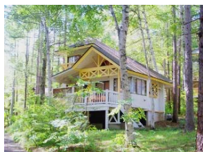
ネオオリエントルリゾートハケ岳 （コテージ）