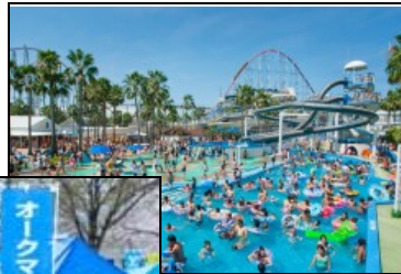
長島ジャンボ 海水プール