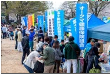
春の健康ウォーク (五条川 江南～岩倉)