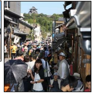
(写真は3年前の同イベントのもので)