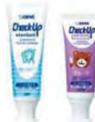
ライオン DENT.チェックアップ