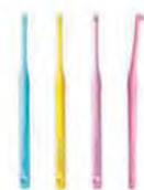
ライオン DENT.ワンダフト