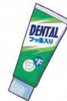
フッ素入り歯磨き剤