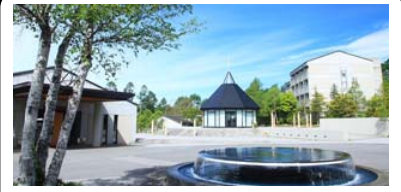
ホテルアンビエント蓼科