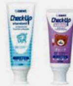
ライオン DENT.チェックアップ