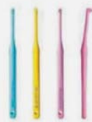
ライオン DENT.ワンタフト