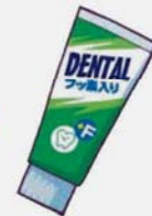
フッ素入り歯磨き剤