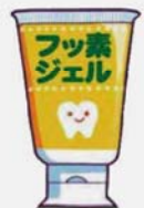
フッ素入りジェル