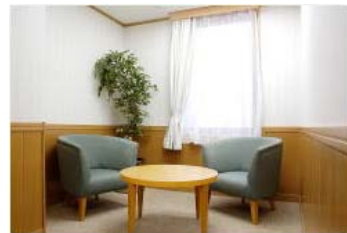
ティーベックカウンセリングルーム