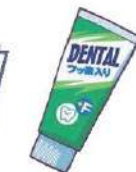
フッ素入り歯磨き剤