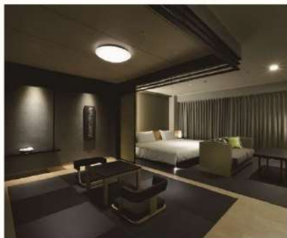
エクシブ鳥羽/ラージ(C)グレード客室例

洗練された客室はエクシブの魅力のひとつ。1室最大5名様まで宿泊可能な洗練された客室で、ゆったりとおくつろぎになれます。