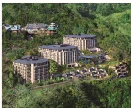
エクシブ箱根離宮/外観

国内に展開するリゾートホテルは、大都市から車で約2~3時間と便利な立地でアクセスも良好です。