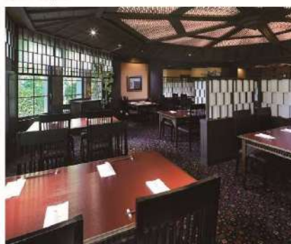
エクシブ蓼科/日本料理 花木鳥

日本料理・イタリア料理・フランス料理・中国料理などの各レストランでは、数種類のコース料理をご用意しています。