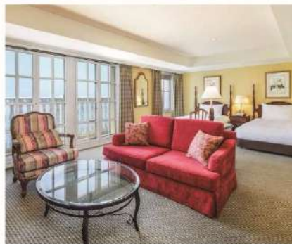
エクシブ琵琶湖/ラージ(C)グレード客室例