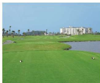
グランディ浜名湖ゴルフクラブ

ゴルフ場やプール、エステ、ジム、テニスコートなど、ホテル内での過ごし方もさまざまです。