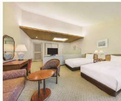
エクシブ軽井沢/ラージ(C)グレード客室例