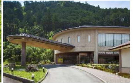
松坂わんわんパラダイス